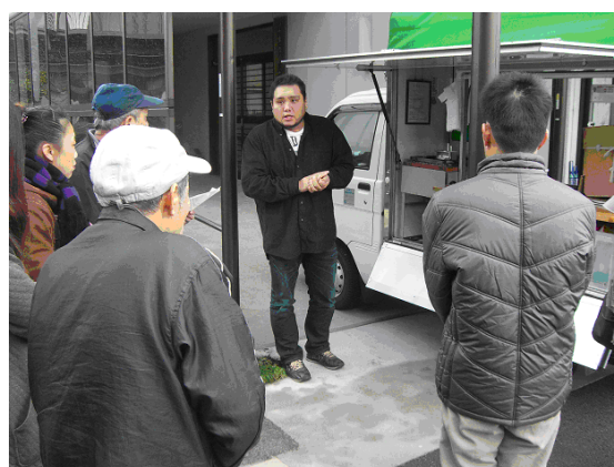
先進地視察の様子