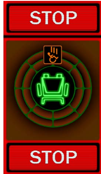
(c) 前進時前方に転倒・転落の危険がある段差を検知し、自動停止