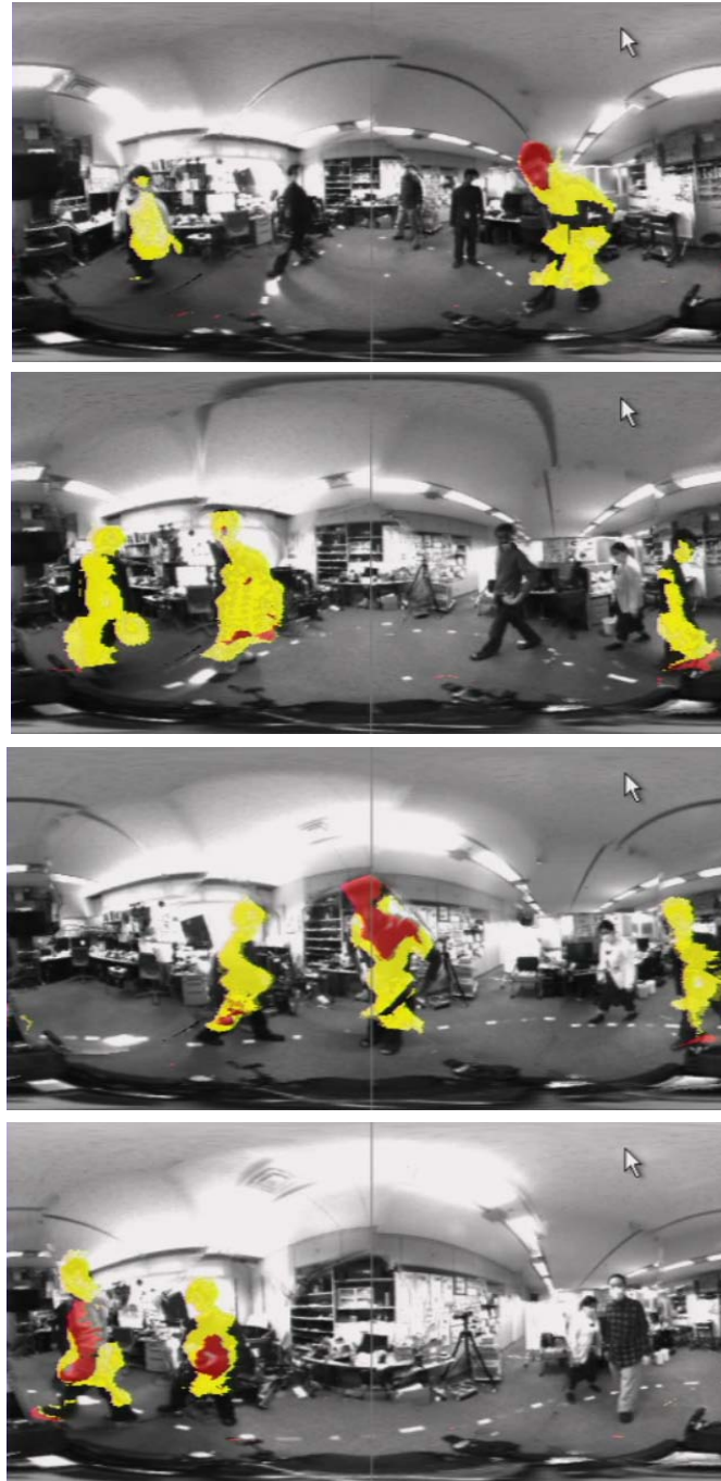
図 C-4-14 全方向距離情報を用いた電動車いす周囲の人物検出の例：電動車いすを走行させながら周囲の人物を検出している。電動車いすから 1.2 m 以内に近づいた部分を黄色、50cm 以内に近づいた部分を赤で表示している（1.2m より遠いものは人物であっても色をつけず、そのまま表示している）。画面はメルカトル図法に基づいたパノラマ画像で、画像の中央が電動車いすの前方、画像の左右端は実際にはつながっていて電動車いすの後方を示す。