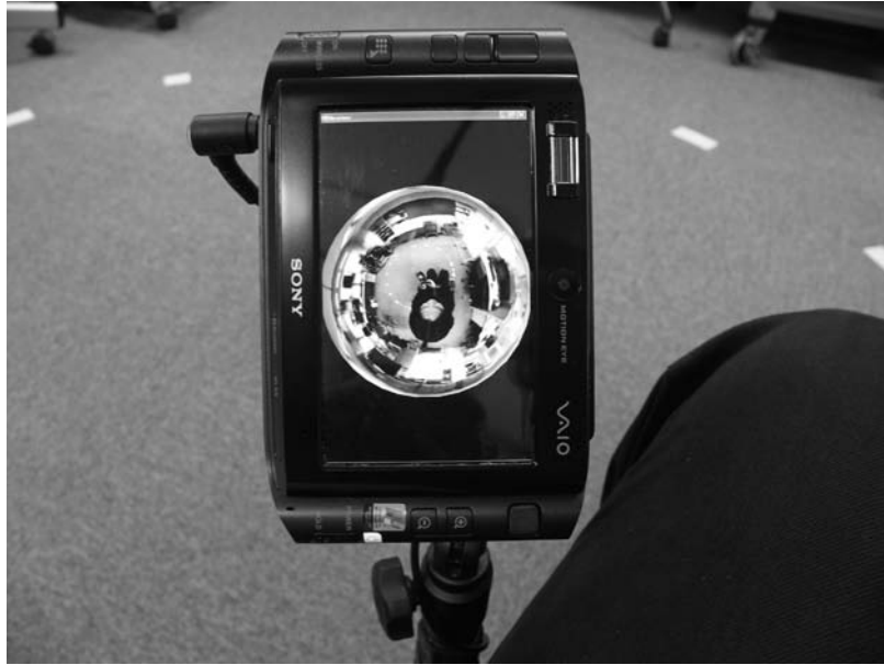
図 C-4-11 情報端末による車いす周囲の確認