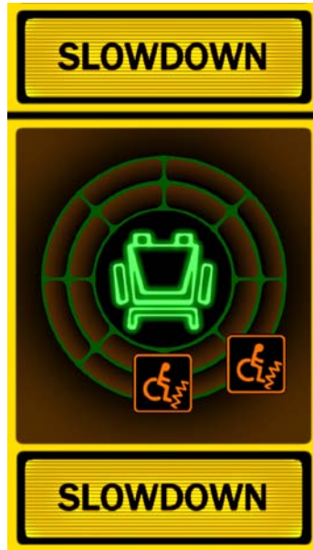
(b) バック時後方から右後方にかけて障害物を検知し自動減速中