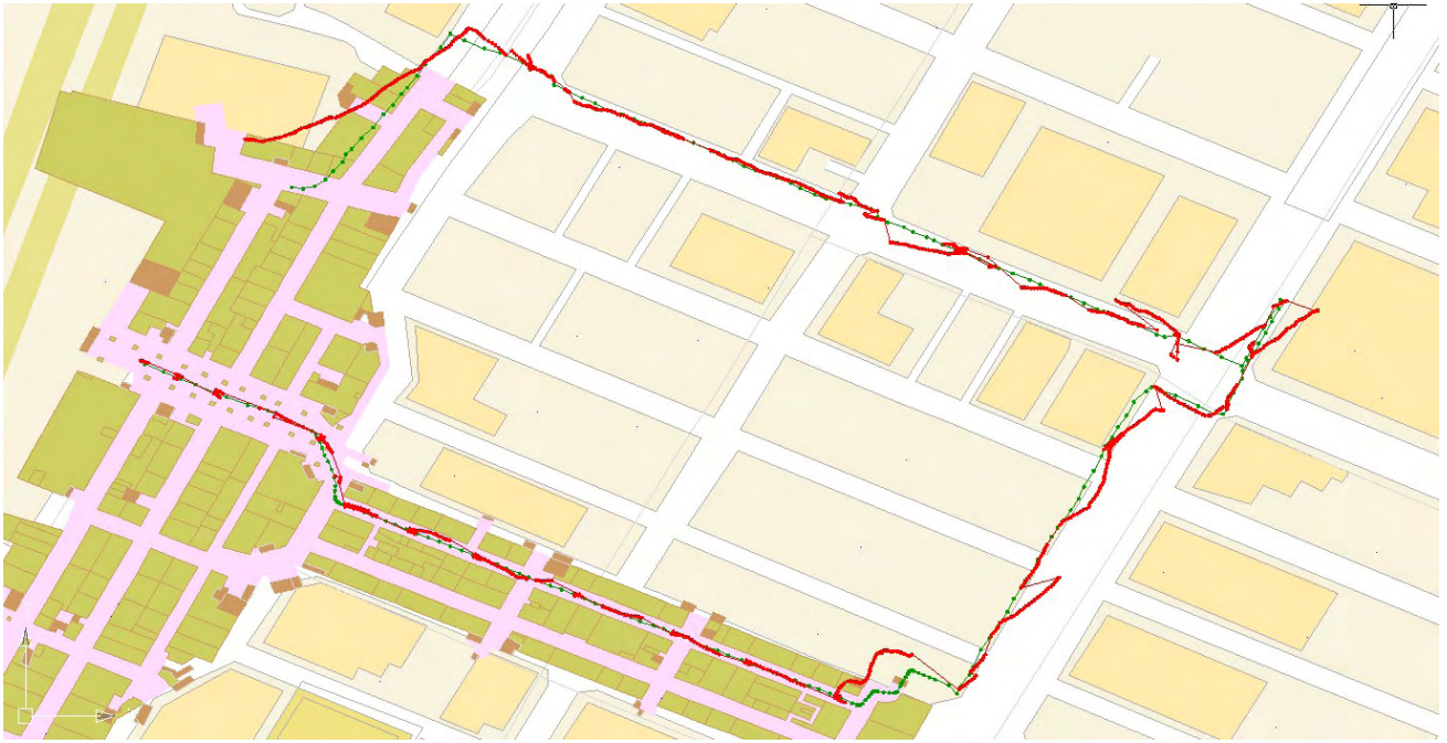
図 II.5.-20 センサ統合による測位結果（赤：計測値、緑：参照値）