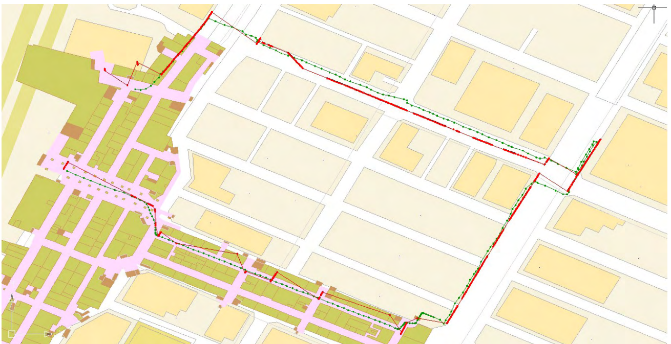
図 II.5.-21 マップマッチングによる測位結果（赤：計測値、緑：参照値）