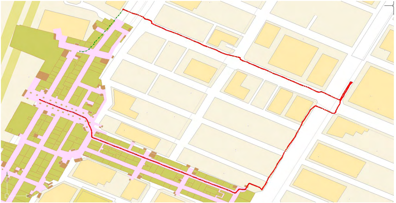
図 II.5.-18 シーン画像認識による測位結果（赤：計測値、緑：参照値）