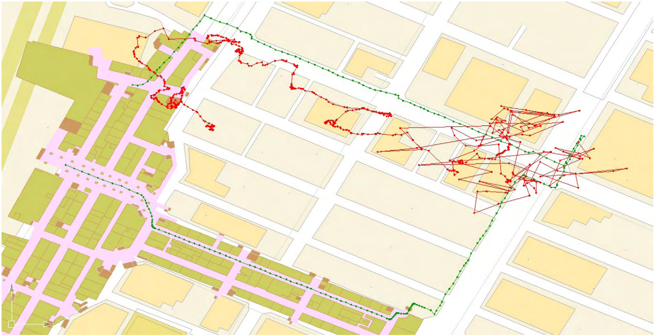
図 II.5.-14 GPS による測位結果 (赤：計測値、緑：参照値)