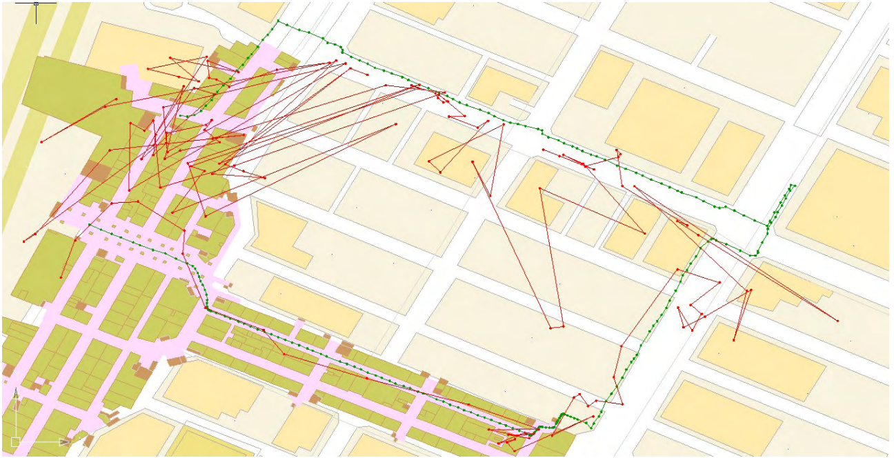
図 II.5.-16 PlaceEngine による測位結果 (赤：計測値、緑：参照値)