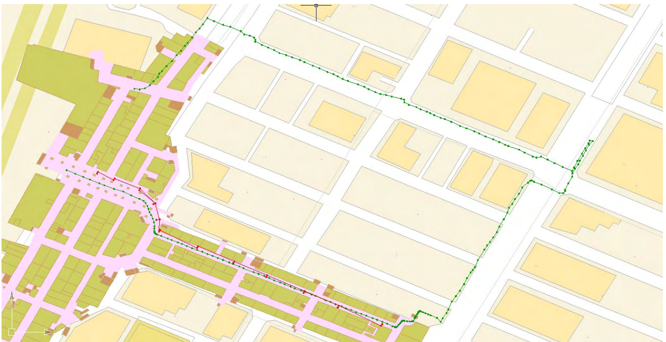
図 II.5.-17 RFID による測位結果 (赤：計測値、緑：参照値)