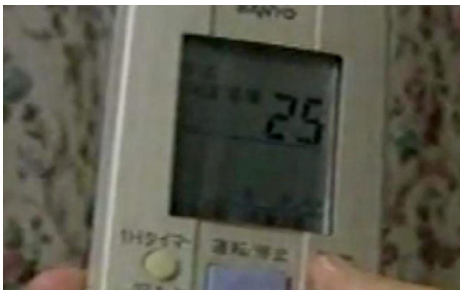
図4 リモコンの液晶表示の問題点

デバイス上に表示されている点字を触察している場面の写真。左手の人差し指で触っている様子。