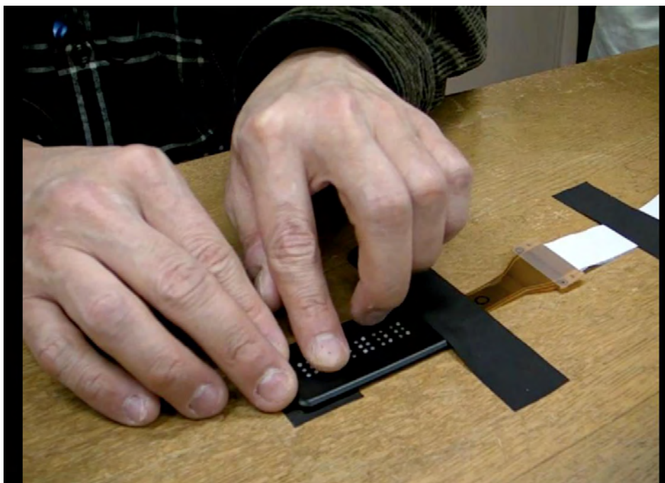
図3 視覚障害者による触読の様子

デバイス上に表示されている点字を触察している場面の写真。左手の人差し指で触っている様子。