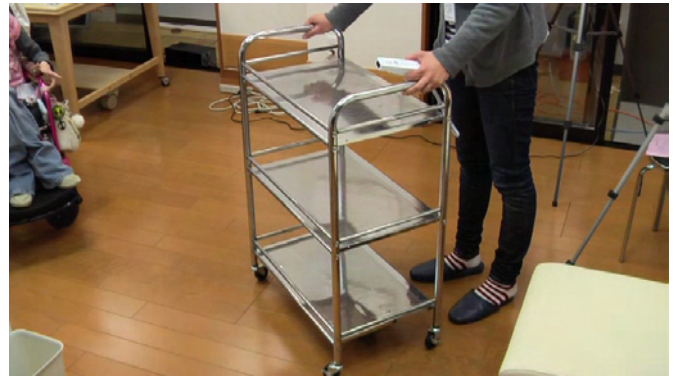
② キャリブレーション動作