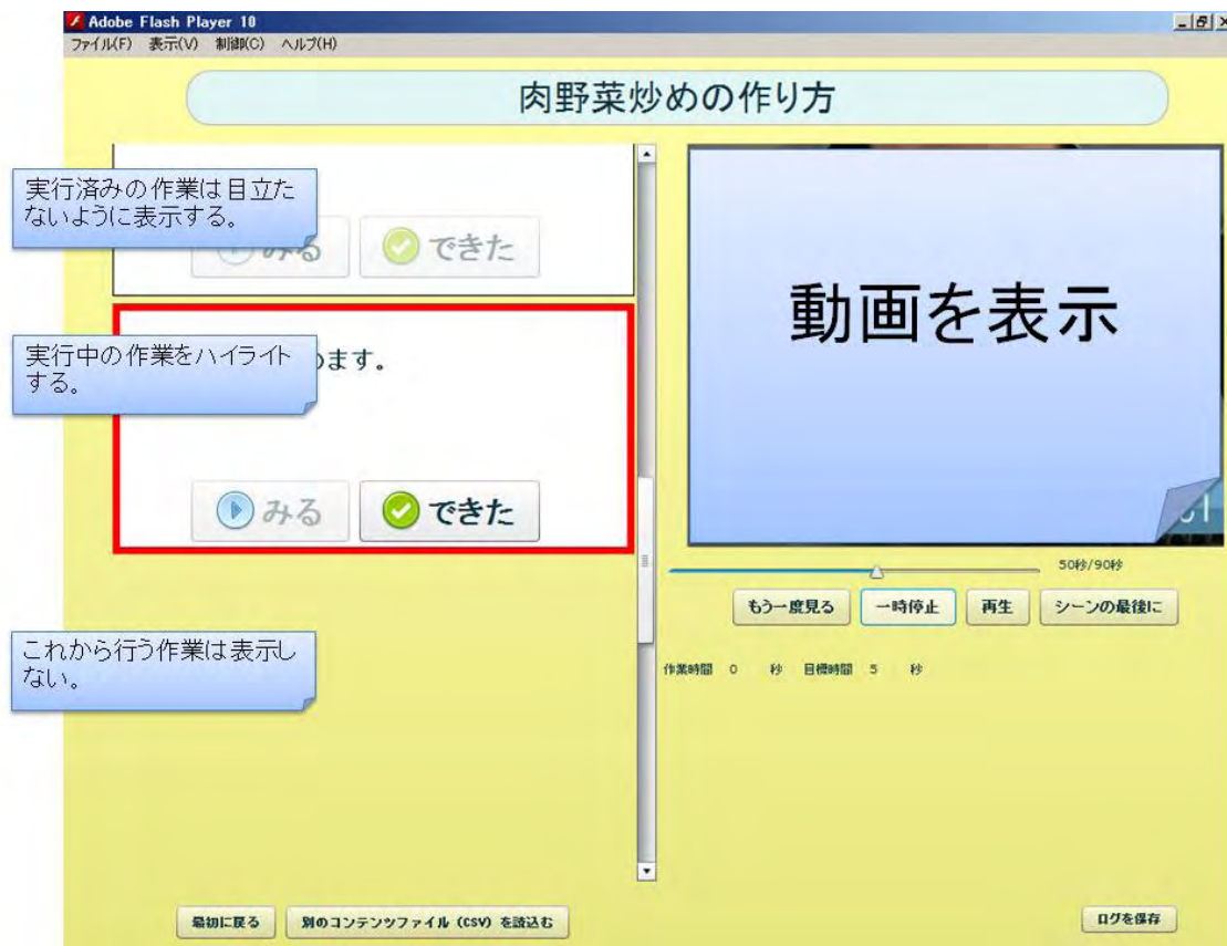
図 II-1-13 プロセス提示支援ツール