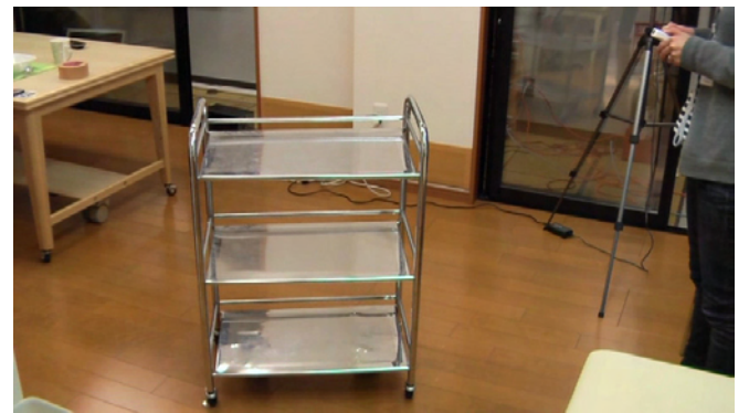
③ リモコンによる配膳カートの制御