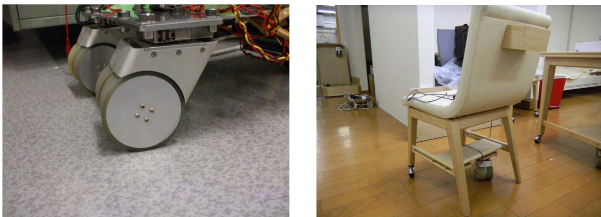
図 I-8 アクティブキャスターおよびアクティブキャスターが取り付けられたイス