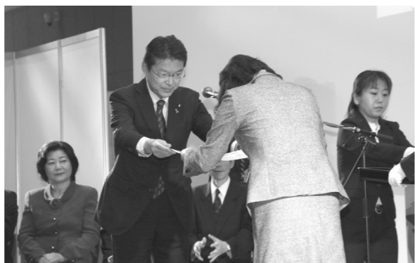
長妻大臣より厚生労働大臣賞を授与

続いて、財団法人長寿社会開発センターによる「明日の介護〜わたしの提言〜」コンクール表彰式が行われ、厚生労働大臣賞をはじめとした各賞の表彰が行われました(左表)。