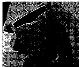
・線量計 身体が受けた被爆量を計測