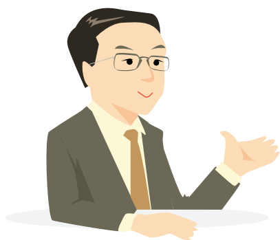
明神館 宿泊支配人

職業能力評価シートは、とても実用的かつ現実的にできています。自社の評価基準を作るための基礎として、あらゆる旅館で活用できるのではないのでしょうか。多くの従業員が働く当社においても、職業能力評価シートを参考に、自社の評価基準をブラッシュアップしています。また、職業能力評価シートに、評価の際の「着眼点」を追記し、さらなるステップアップを後押しするツールとして活用することも考えています。