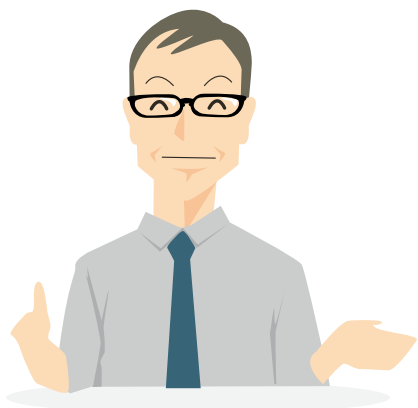
ホテル佐勘 総務部次長

職業能力評価シートは、とても実用的かつ現実的にできています。自社の評価基準を作るための基礎として、あらゆる旅館で活用できるのではないのでしょうか。多くの従業員が働く当社においても、職業能力評価シートを参考に、自社の評価基準をブラッシュアップしています。また、職業能力評価シートに、評価の際の「着眼点」を追記し、さらなるステップアップを後押しするツールとして活用することも考えています。