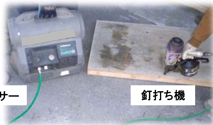
エアコンプレッサー