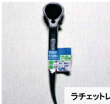
ラチェットレンチ