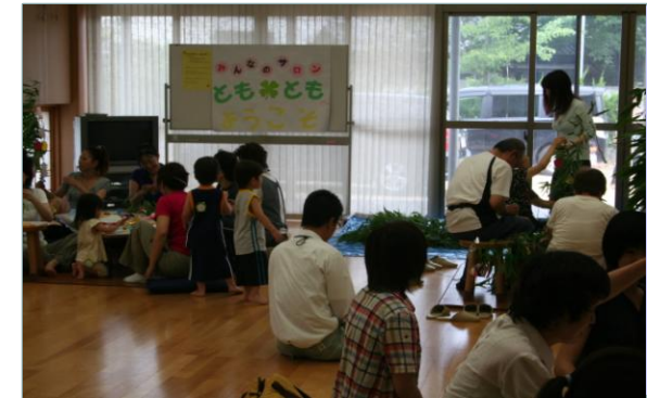
《『みんなのサロン とも*とも』 におじゃましました！》