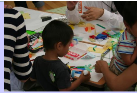
《願いごとがかなうといいね！》