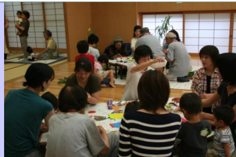
《七夕です！ みんなで短冊製作中》