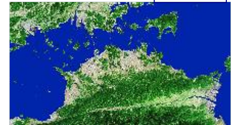
地域雇用失業情勢 (事業開始時点の有効求人倍率)