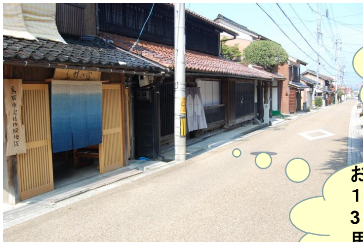
風情のある城下町 鹿野町のお試し体験施設

一口に移住定住、二地域居住といっても様々なケースが考えられるので大変です。まず、鳥取市を知ってもらう参加型の様々な体験メニューを旧鳥取市域、また新たな新市域(国府・福部・河原・用瀬・佐治・鹿野・気高・青谷)で展開。おためし宿泊体験施設もあります。(ホームページ http://www.city.tottori.lg.jp/ )