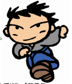
大河ドラマ「龍馬伝」 長崎県推進協議会キャラクター 「ながさき龍馬くん」

NHK大河ドラマ「龍馬伝」 龍馬は、薩摩藩の援助を受けながら日本初の商社「亀山社中」を長崎で結成します。その後「海援隊」へと発展させ、外国商人グラバーやオルトと取引します。慶応3年に京都近江屋で暗殺される寸前まで龍馬は長崎で活躍しました。全国の龍馬ファンのみならず、長崎でお待ちしております。