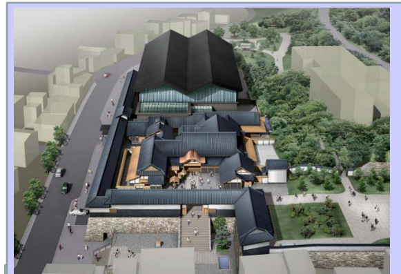
《大河ドラマ館が設置された長崎歴史文化博物館》

県外からのお客様の自家用車および観光バス対策として設置した臨時駐車場での誘導および長崎県内・市内の観光案内