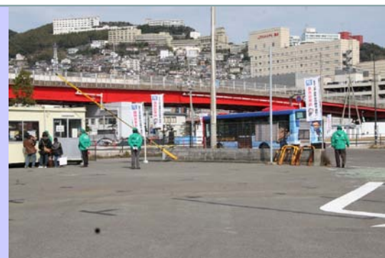
《臨時駐車所での誘導案内業務》