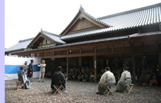
《龍馬伝館での寸劇を見入るお客様》

朝8時から夕方7時までのショップでは、二交代制で4人の仲間が働いています。 とにかく笑顔を決やさずお客様をお迎えし、長崎のファンになっていただけようみんなで頑張っています。