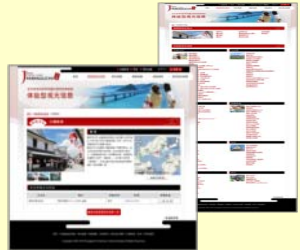
【体験型観光のページ】

○多くの海外の方々にサイトを繰り返し観てもらえるよう、サイト内容を 充実します。 ○リスティング広告の効果的な展開により、アクセス数を伸ばします。