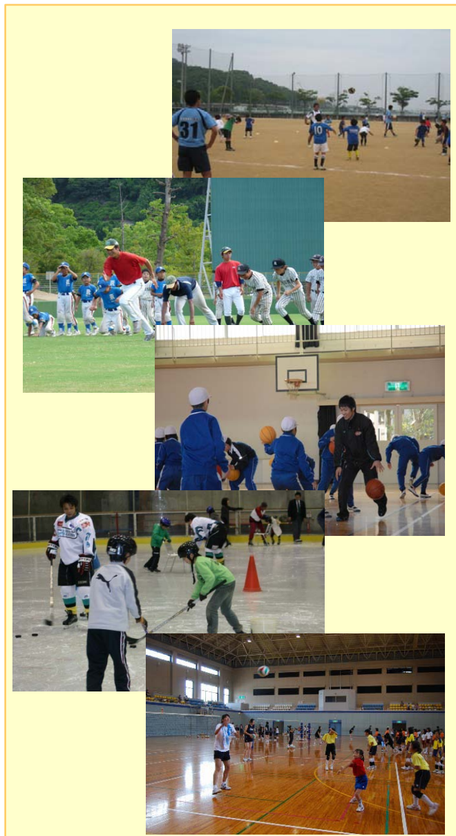
【スポーツ教室の様子】

今後も積極的に地域のつながりを大切にして、できるだけ長期間事業として活動し、少しずつ地域に浸透していくよう努めていきます。