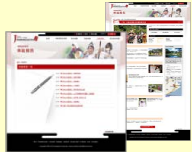
【体験レポートのページ】