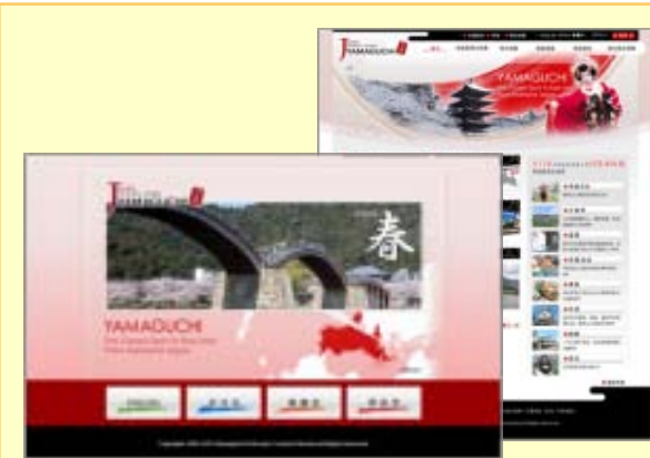
【山口県海外用ウェブサイト】