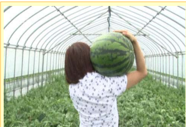
【時には体当たり取材も】