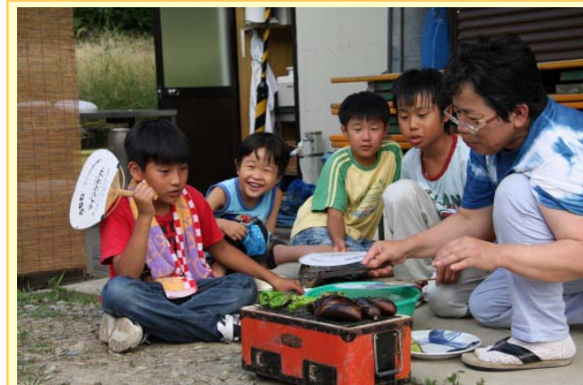
【受け入れ農家での体験】