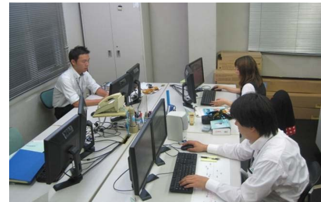
雇用者のデスクでの作業風景