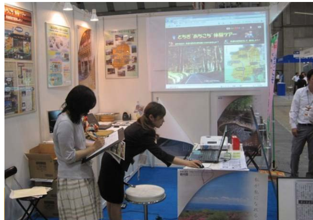
業務成果展示会での案内風景

ネット配信した街道沿道画像に、ユーザの興味をもつようなコンテンツを盛り込んでいき、栃木の観光誘客に欠かすことのできないツールに育てていきたい。