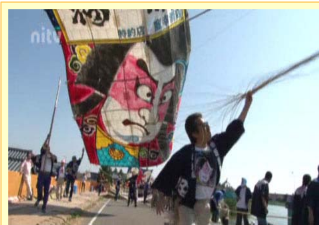
【迫力ある映像がいっぱい】