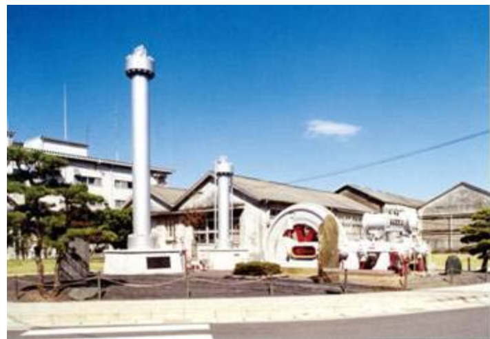
国内で初めてアンモニアを生産したカザレ式合成装置