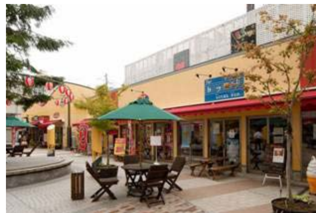
中心市街地のパサージュ広場