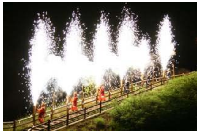
地獄谷で行われるイベント(鬼花火)