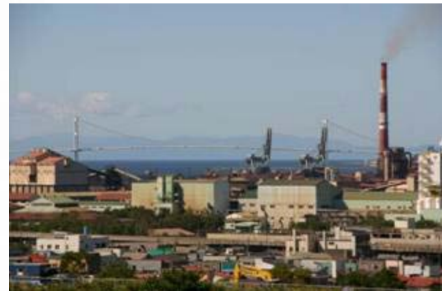
工場群と白鳥大橋