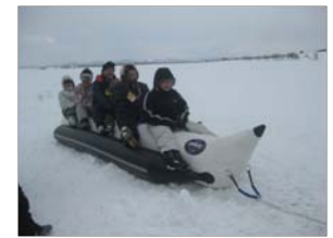
スノーボード体験