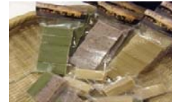
姉妹品の「よもぎ餅」「玄米餅」