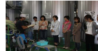
ワイナリー裏側見学ツアー