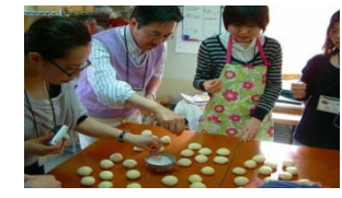
ピザ・パン作り体験