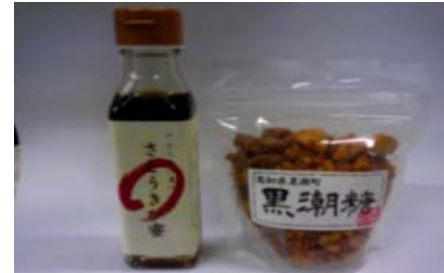
黒潮糖、さとうきび蜜