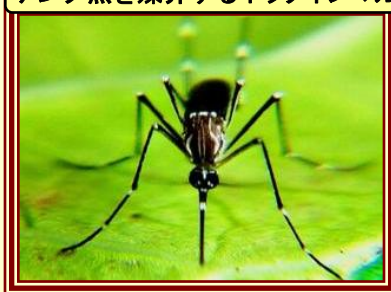
デング熱を媒介するネッタイシマカ