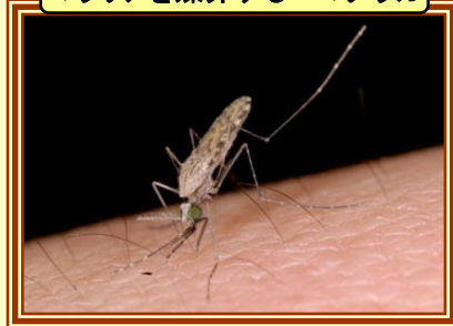
マラリアを媒介するハマダラカ