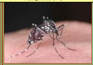
チクングニヤ熱を媒介するヒトスジシマカ