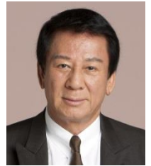
厚生労働省 肝炎総合対策推進 国民運動 特別参与 杉 良太郎