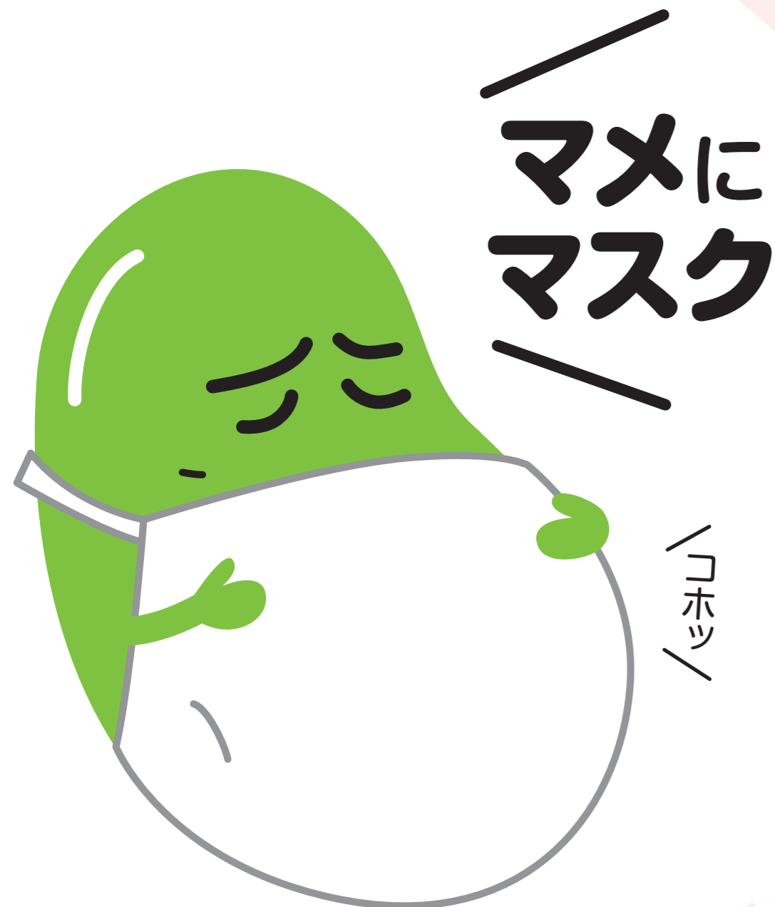
インフルエンザ 予防啓発キャラクター マメソウくん

手洗いでインフルエンザを予防して、かかったらマスク等でせきエチケット。みんなの「かからない」、「うつさない」という気持ちが、インフルエンザの予防にはとても大切です。