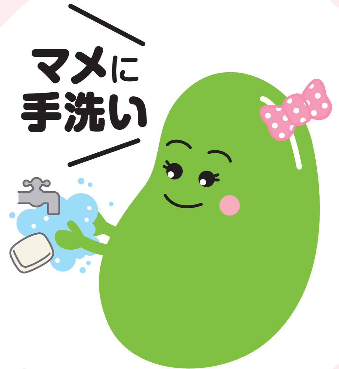
インフルエンザ 予防啓発キャラクター アズキちゃん