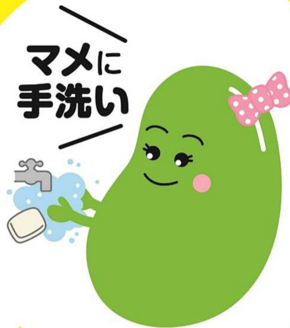
インフルエンザ 予防啓発キャラクター アズキちゃん