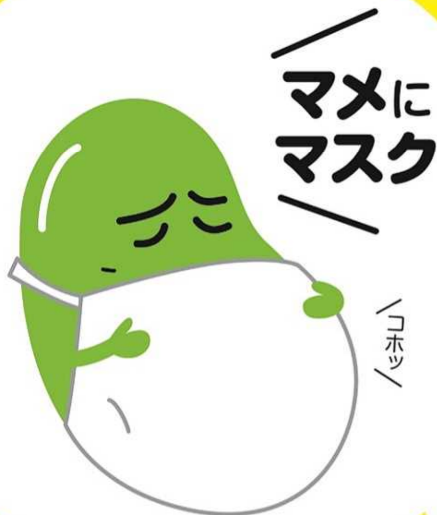
インフルエンザ 予防啓発キャラクター マメゾウくん

手洗いでインフルエンザを予防して、かかったらマスク等でせきエチケット。みんなの「かからない」、「うつさない」という気持ちが、インフルエンザの予防にはとても大切です。