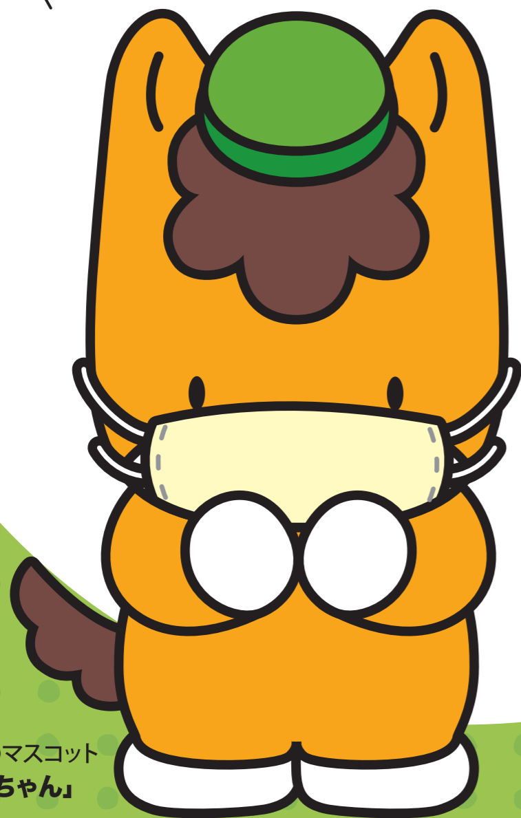
群馬県のマスコット 「ぐんまちゃん」

いんぷるえんざのあひせうには みんなの「かからぬい」、「うつさぬい」という きもちがとともしんせうです。 てあらいでいんぷるえんざをあひせうして、 かかったら、マスク等せきえちけつとも わすれぬいでください。