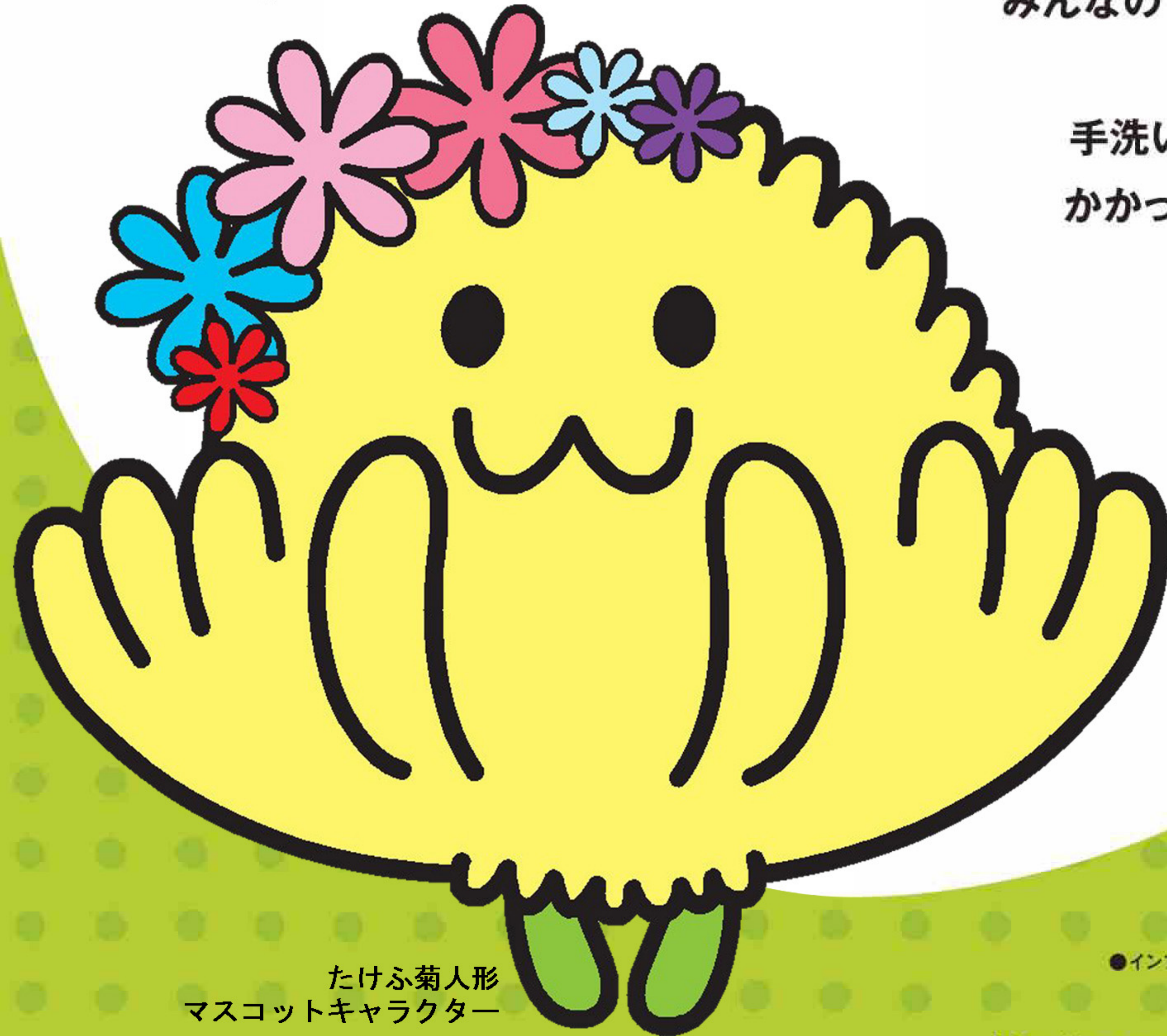
たけふ菊人形 マスコットキャラクター きくりん

インフルエンザの予防には みんなの「かからない」、「うつさない」という 気持ちがとても大切です。 手洗いでインフルエンザを予防して、 かかったら、マスク等せきエチケットも 忘れないでください。