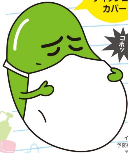
インフルエンザ 予防啓発キャラクター マメゾウくん