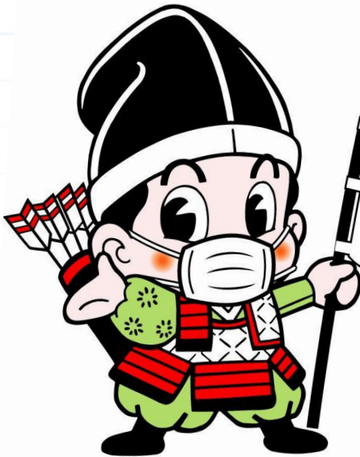
大田原市イメージキャラクター 与一くん