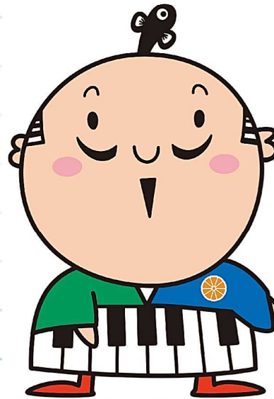
出世大名 家康くん