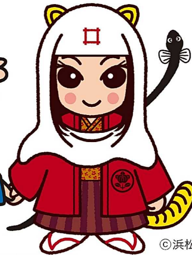
出世法師 直虎ちゃん