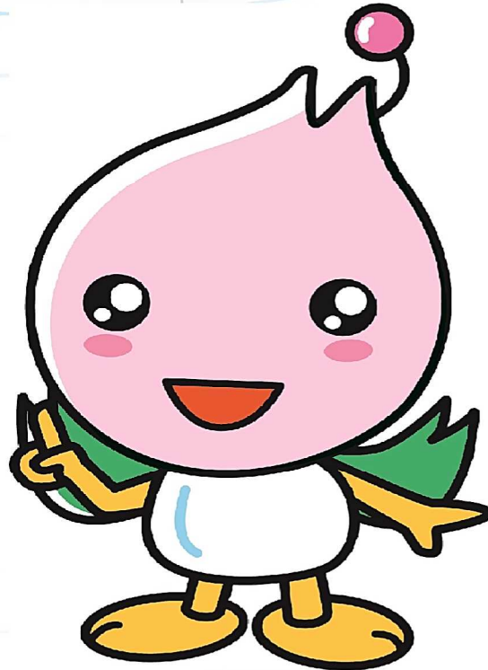
各務原市 マスコットキャラクター らららちゃん