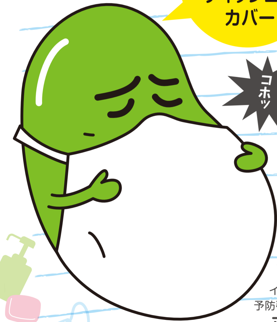
インフルエンザ 予防啓発キャラクター マメソウくん