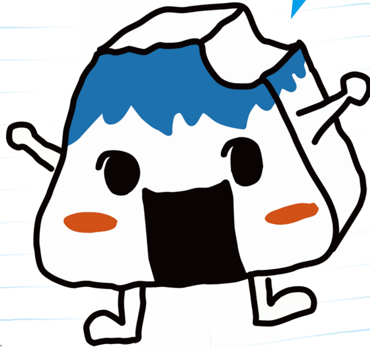
富士市食育キャラクター むすびん