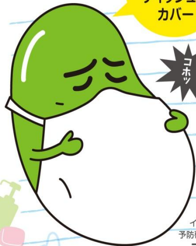
インフルエンザ 予防啓発キャラクター マメソウくん