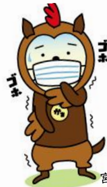
宮崎県シンボルキャラクター みやざき犬