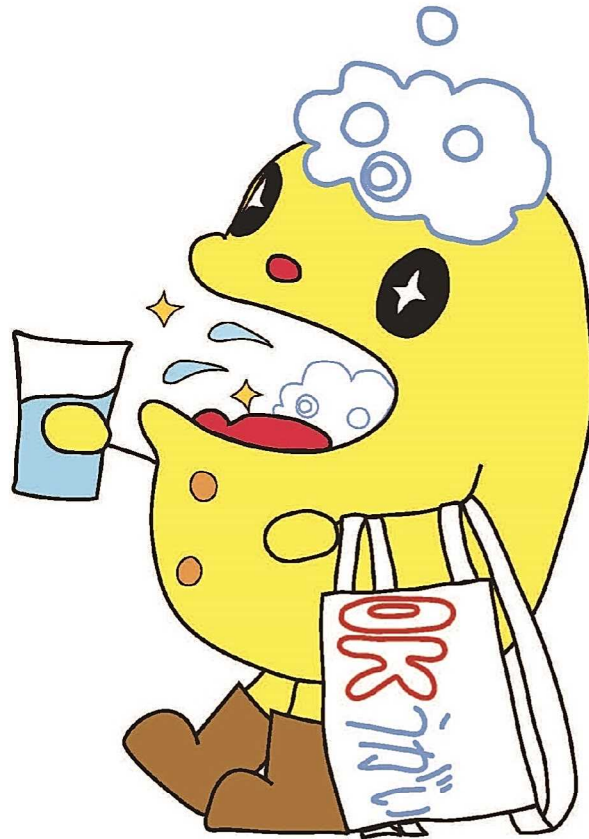
大阪府インフルエンザ対策マスコットキャラクター マウテ君