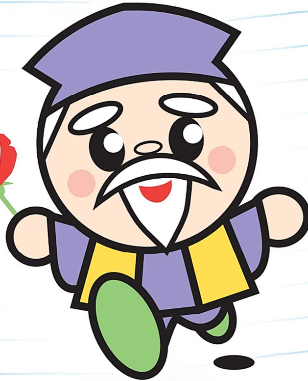
茨城県マスコットキャラクター ハッスル黄門