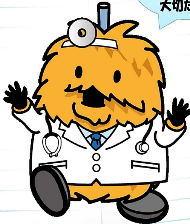
栗原市マスコットキャラクター