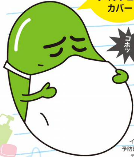
インフルエンザ 予防啓発キャラクター マメゾウくん