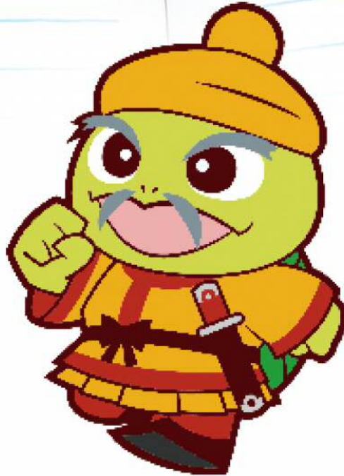
新潟市東区 マスコットキャラクター ぬたりん