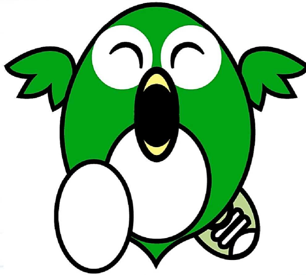
佐賀県 鳥栖市イメージキャラクター とっとちゃん