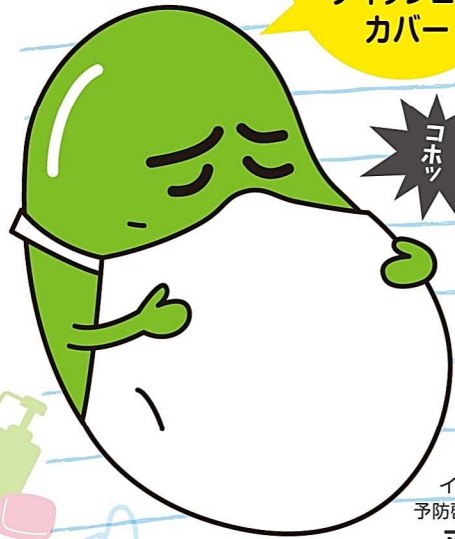
インフルエンザ 予防啓発キャラクター マメゾウくん