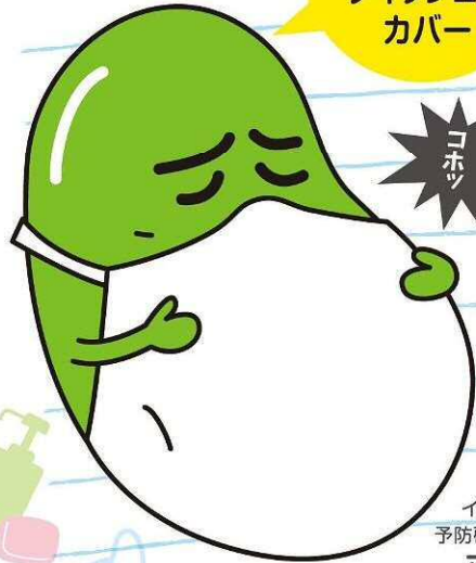
インフルエンザ 予防啓発キャラクター マメソウくん