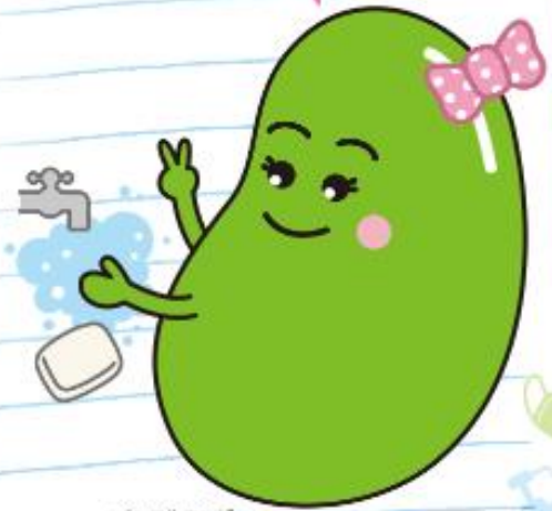
インフルエンザ 予防啓発キャラクター アズキちゃん