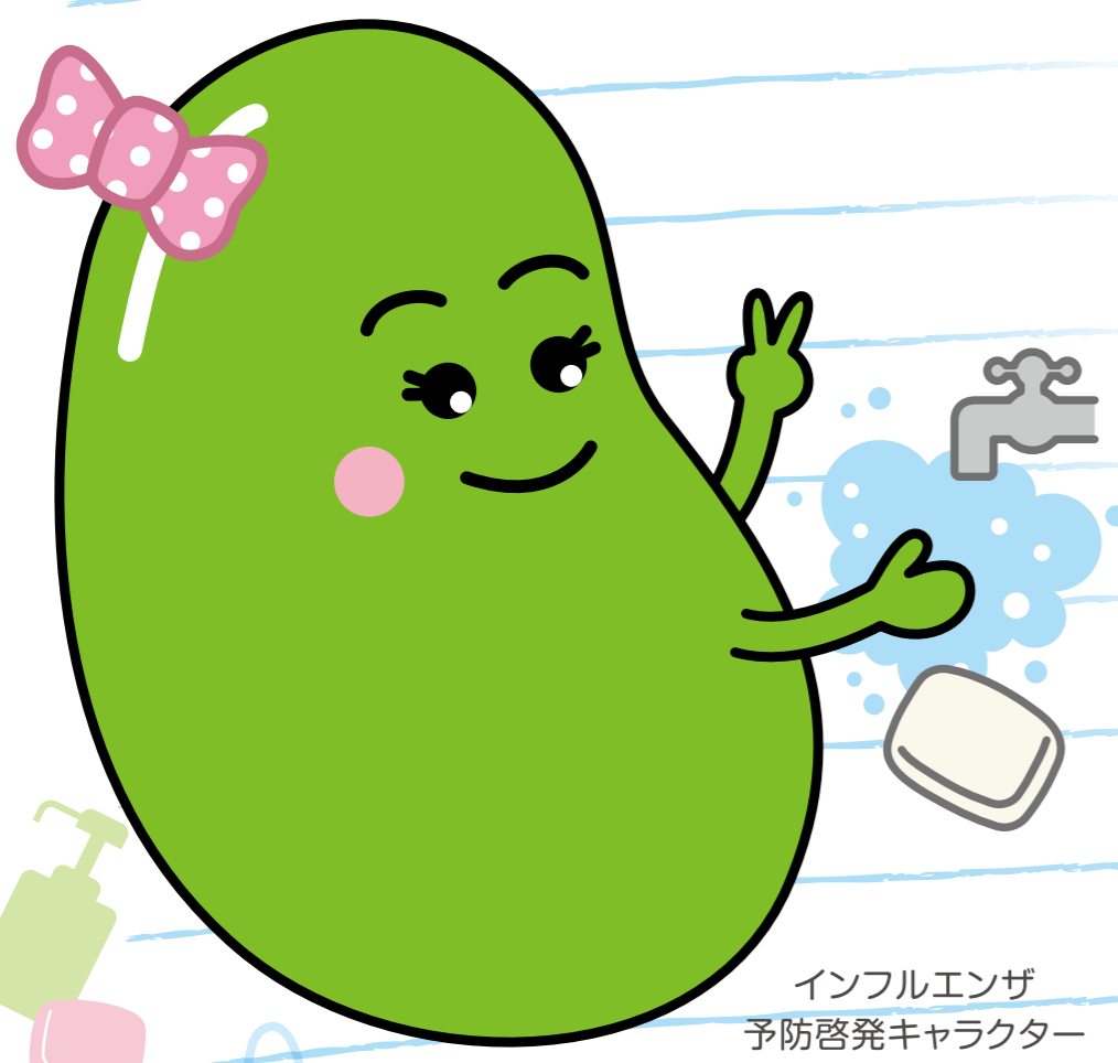
インフルエンザ 予防啓発キャラクター アズキちゃん