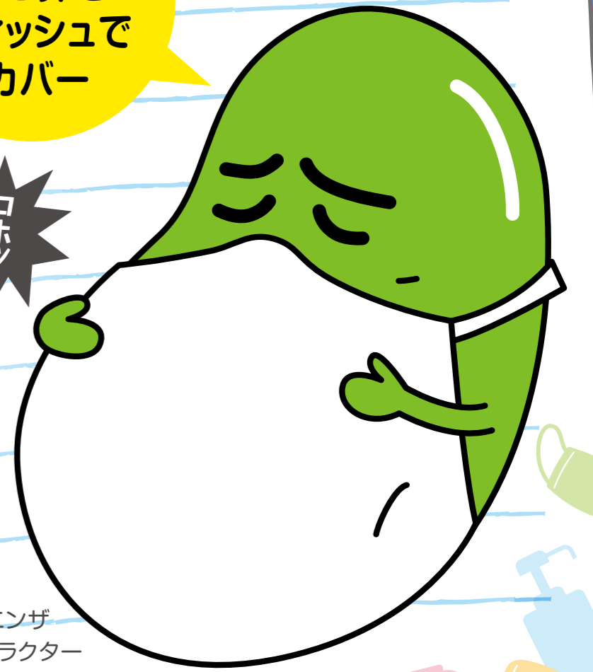
インフルエンザ 予防啓発キャラクター マメゾウくん