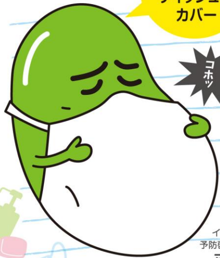
インフルエンザ 予防啓発キャラクター マメソウくん