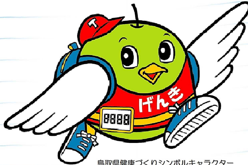
鳥取県健康づくりシンボルキャラクター げんきトリピー