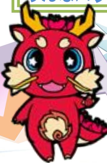
上ノ国町 かみごん