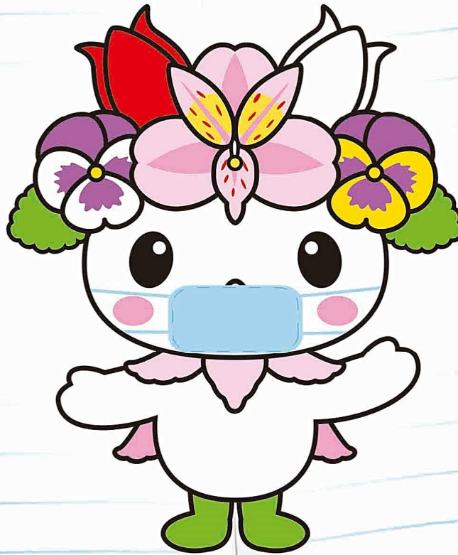
東神楽町マスコットキャラクター かぐらっき〜