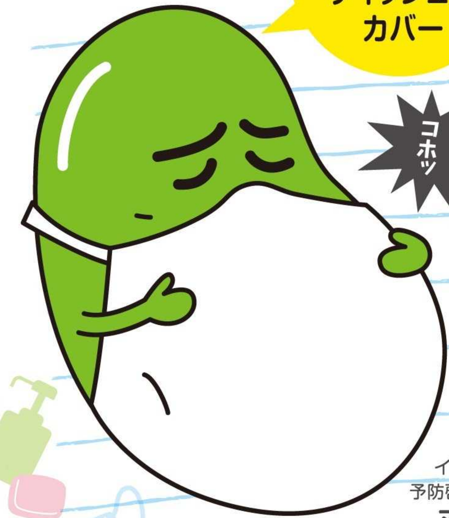
インフルエンザ 予防啓発キャラクター マメソウくん