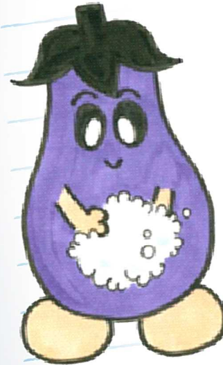
印西市の健康づくりの マスコット ナスちゃん