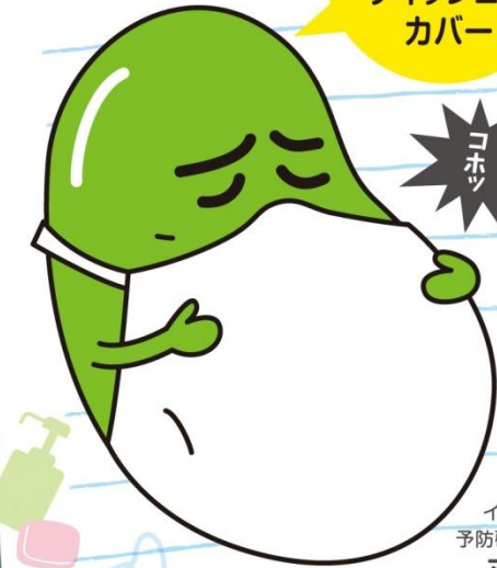
インフルエンザ す防啓発キャラクター マメソウくん