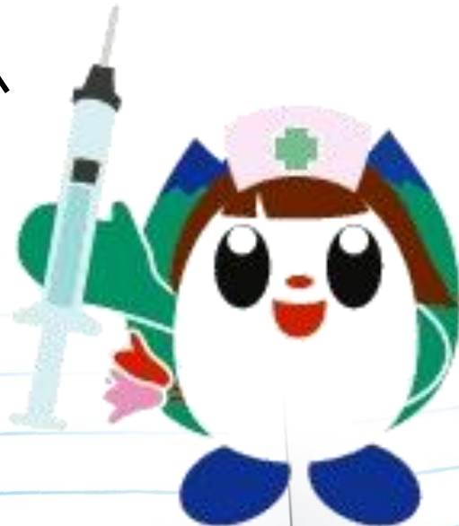
飯島町イメージキャラクター いいちゃん(ナースver)