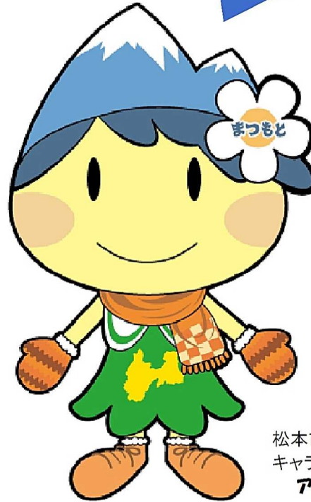
松本市マスコット キャラクター アルプちゃん