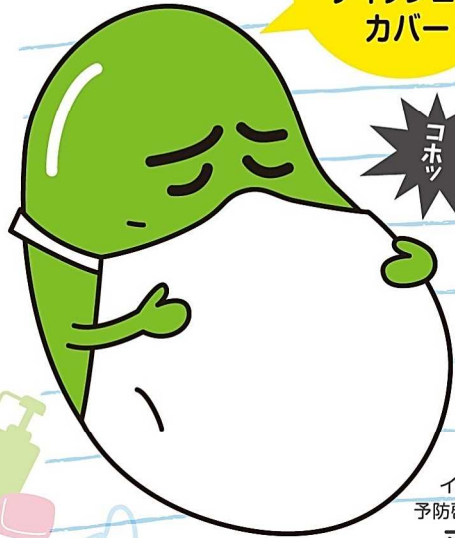
インフルエンザ 予防啓発キャラクター マメゾウくん