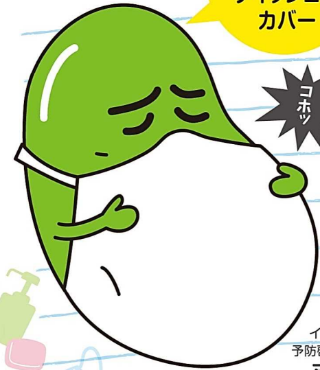
インフルエンザ 予防啓発キャラクター マメゾウくん