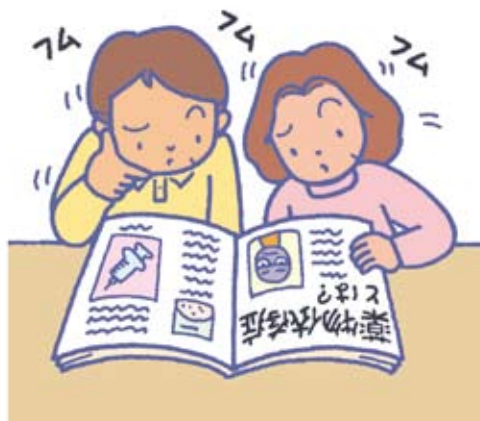
薬物依存症について学びましょう。

二つ目は、薬物依存症者ご本人に対する適切な対応方法を身につけることです。ご家族の方