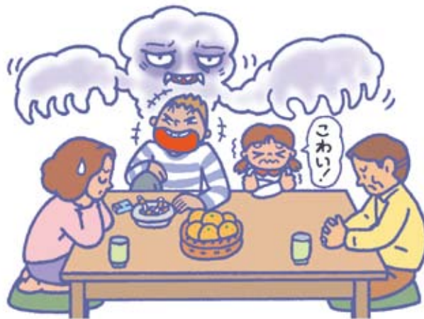
薬物依存症は 家族を巻き込む障害！

薬物依存症は、その人の心と身体をむしばむだけではありません。家族の誰かが薬物依存症におちいると、家族はその悪い影響を受けて、気がつかないうちに病んでいきます。依存症が「家族の病」とされているのはこのためです。